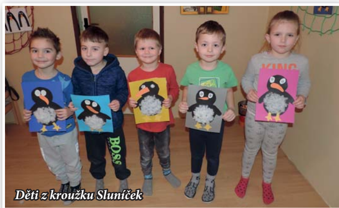
Děti z kroužku Sluníček