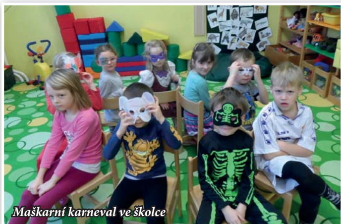
Maškarní karneval ve školce