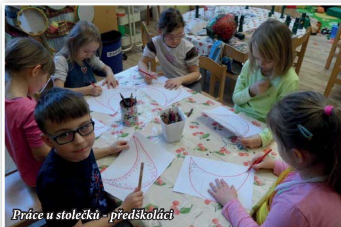
Práce u stolečků - předškoláci