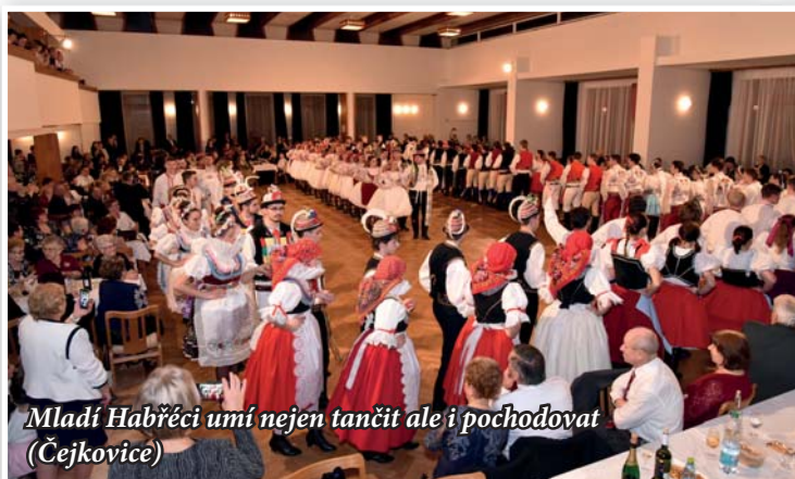
Mladí Habřeci umí nejen tančit ale i pochodovat (Čejkovice)