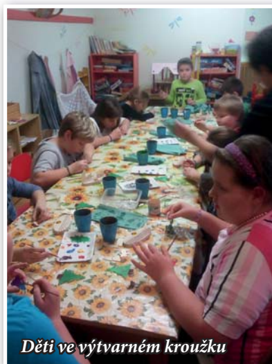
Děti ve výtvarném kroužku