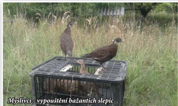
Myslivci - vypouštění bažantích slepic