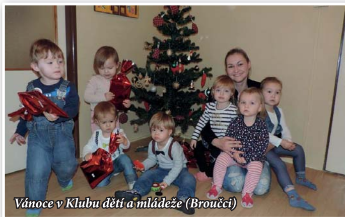
Vánoce v Klubu dětí a mládeže (Broučci)