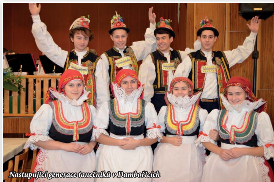
Nastupující generace tanečníků v Dambořicích

S ohledem na to, jak dlouho reprezentují Lovčice na plesech, umí někteří besedy tři, jiní dvě, všichni se shodují na tom, že aktuálně procvičovanou besedu umí nejlépe, mají ji v paměti a dokázali by ji celou bez problémů zatančit.