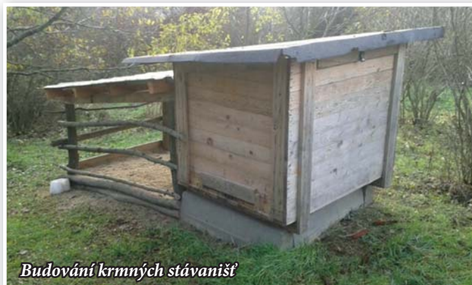
Budování krmných stávaníšť