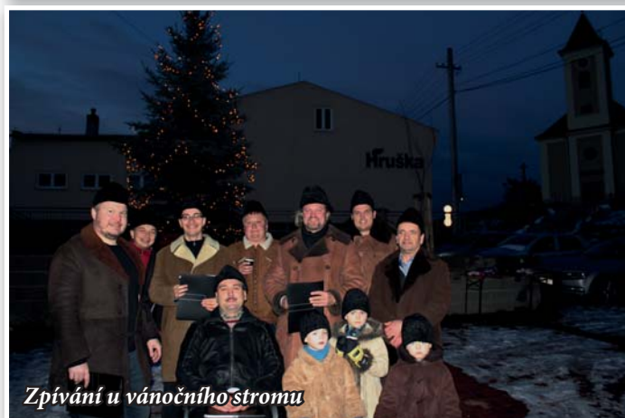
Zpívání u vánočního stromu