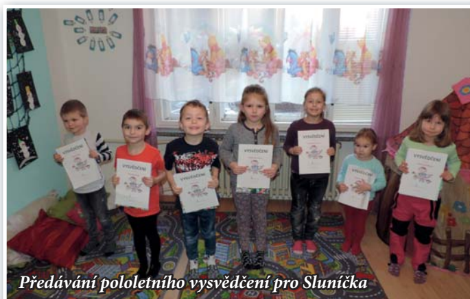
Předávání pololetního vysvědčení pro Sluníčka