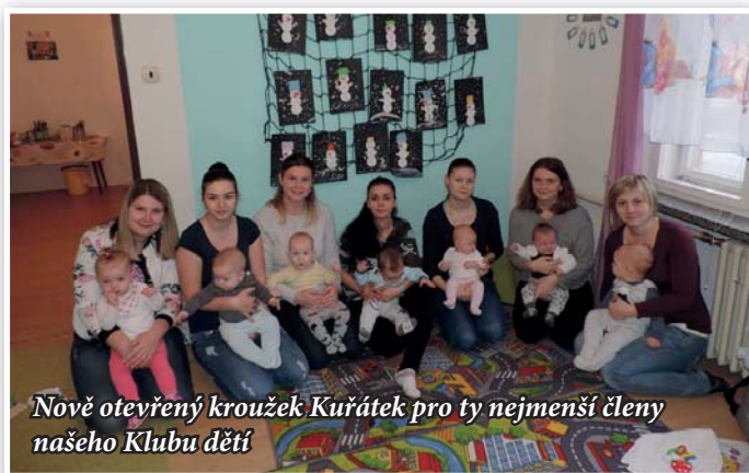
Nově otevřený kroužek Kuřátek pro ty nejmenší členy našeho Klubu dětí

Od nového roku jsme otevřeli nový kroužek pro nejmenší členy našeho klubu dětí, pro maminky a jejich miminka od narození do věku 1 roku. Do Kuřátek dochází 7 dětí a scházíme se pravidelně 1x týdně. Nabízí se otázka, co s tak malými dětmi v kroužku můžeme dělat? Zpíváme, učíme se krátké jednoduché básničky, maminky si v druhé půlce hodiny něco kreativního vyrobí, ale hlavně se sejdeme v jiném prostředí, než kde se děti s maminkami běžně pohybují, zároveň se scházíme ve skupině s těmi, se kterými si můžeme vyměnit své názory, zkušenosti a rady v oblasti péče o děti. Velmi cenným bonusem našich setkání je i odreagování se od běžné denní rutiny.