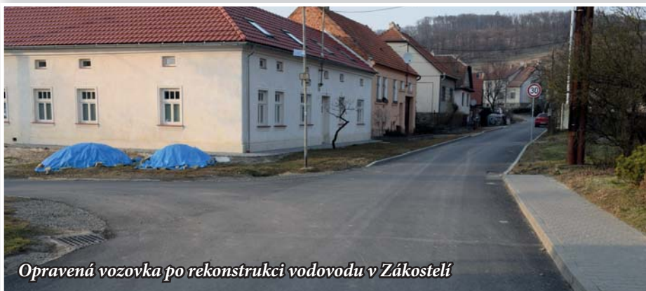
Opravená vozovka po rekonstrukci vodovodu v Zákostelí