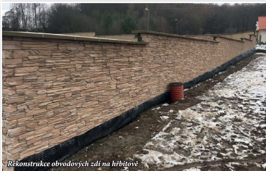
Rekonstrukce obvodových zdí na hřbitově

Pro kulturně společenský život v obci je