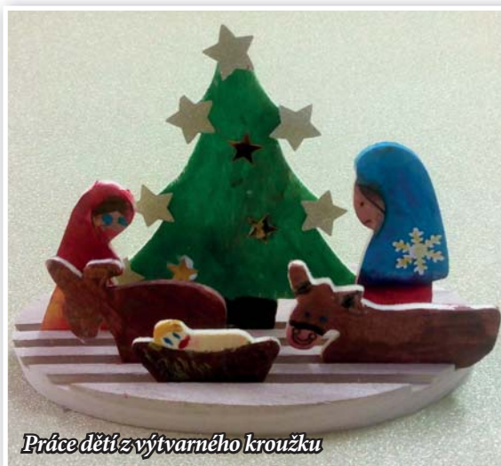
Práce dětí z výtvarného kroužku