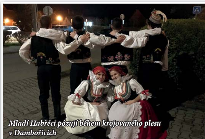
Mladí Habřeci pózují během krojovaného plesu v Dambořicích