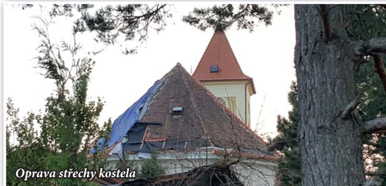
Oprava střechy kostela