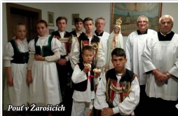
Pouť v Žarošicích