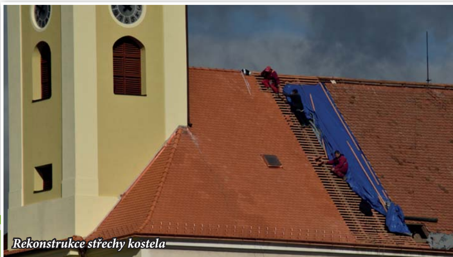
Rekonstrukce střechy kostela