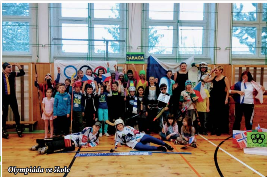
Olympiáda ve škole

Byla vyvěšena olympijská vlajka, sportovci dali svůj slib fair-play, doputovala i pochodně a po olympijském kvízu kolem 9. hodiny ranní vypukly první soutěže. Všichni sbírali body v pěti disciplínách – hokeji, biatlonu, curlingu, skoku na lyžích a rychlobruslení. V polovině zápolení bylo otevřeno olympijské „bifé“, kde se hráči občerstvili a pokračovali dál. Před obědem si všichni vybarvili a pově-