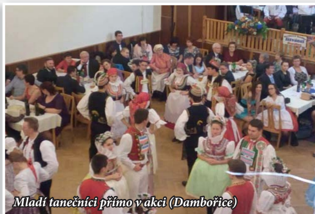
Mladí tanečníci přímo v akci (Dambořice)