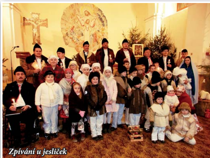
Zpívání u jesliček