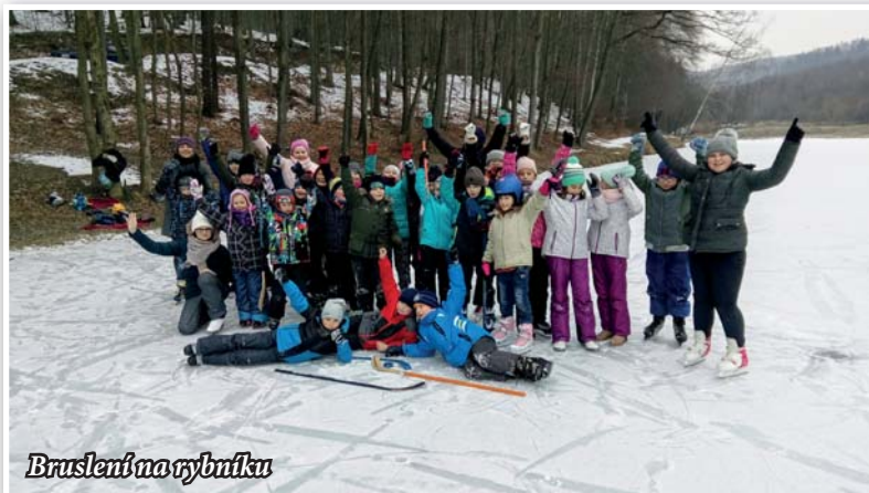
Bruslení na rybníku