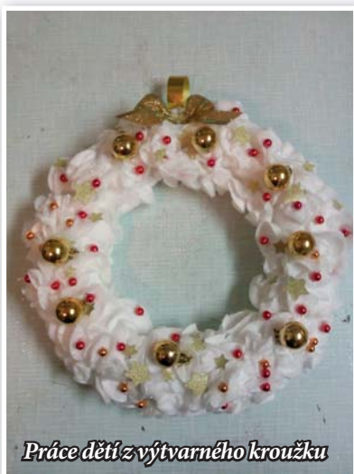
Práce dětí z výtvarného kroužku