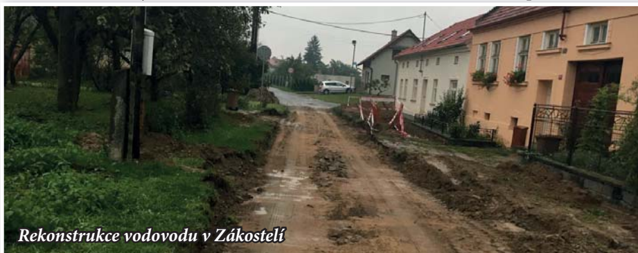
Rekonstrukce vodovodu v Zákostelí

V loňském roce se podařilo opravit místní komunikaci za kostelem, která byla v dezolátním stavu a muselo dojít k odbagrování kostek, srovnání podloží, živичnému postřiku a položení nové asfaltové vrstvy. Totéž bylo realizováno i na příjezdové cestě ke hřbitovu a přilehlém parkovišti. V letošním roce bude pokračovat re-