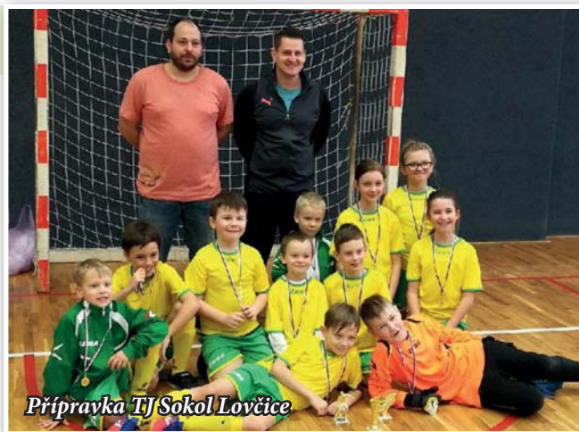
Přípravka TJ Sokol Lovčice

věku. A těšíme se, že se nás na hřišti sejde ještě o něco více. Mužstvo mladších žáků se před jarní sezónou zúčastnilo několika zimních turnajů, kde jsme odehráli spoustu kvalitních utkání, které nám ukázaly, kde a jak ještě zlepšovat naše kvality. Do začátku jarní sezony zbývá jen několik dní, a proto nesmíme nic nechat náhodě, je třeba pilně trénovat a odehrát pár přípravných zápasů.