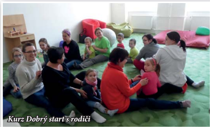
Kurz Dobrý start s rodiči

Nyní máme ještě plnou hlavu olympiády, kterou jsme vnímali a prožívali. Ve školce jsme si společně zařadili při hrách na sportovce, soutěžili jsme ve družstvech, vytvářeli vlajky a pořádně fan-