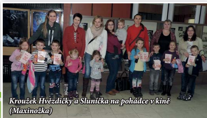
Kroužek Hvězdičky a Sluníčka na pohádce v kině (Maxinožka)