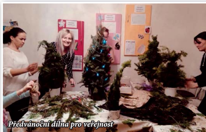
Předvánoční dílna pro veřejnost