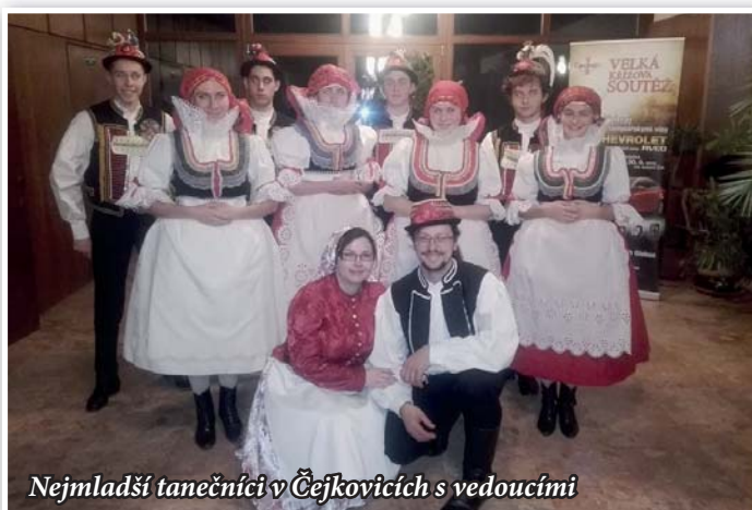
Nejmladší tanečníci v Čejkovicích s vedoucími

Jak naše pátrání vlastně dopadlo? Zajisté pozitivně. Pokud se v naší obci nacházejí teenageři, kteří smýšlejí protradičně, jak je z anket patrné, pak se o osud Lovčic nemusíme bát. A za to budme všichni rádi.