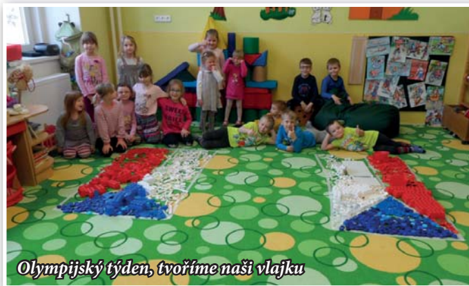
Olympijský týden, tvoříme naši vlajku